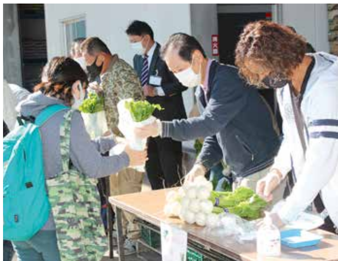
小かぶを販売する柏地区運営委員会の皆さん