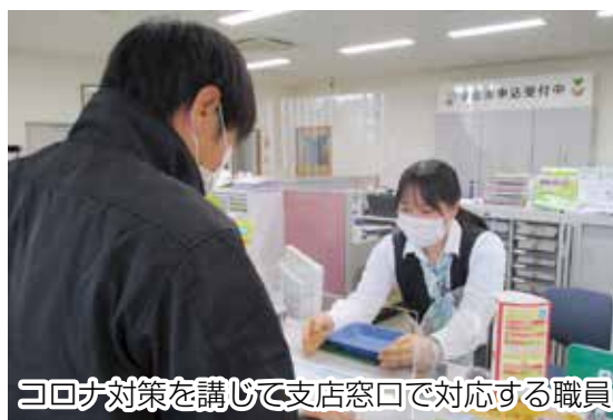
コロナ対策を講じて支店窓口で対応する職員

当JAでは2月末に対策本部を設置。毎朝の検温、通勤方法、顧客宅訪問時の対応等で、状況に応じた対策を講じてきました。対策本部では感染拡大を受け、本支店、経済センター入口などにスタンド式タブレット型サーマルカメラの設置を決定。また、帰省・旅行の集中回避のために政府が呼びかける年末年始休暇の分散・追加延長にも協力する事を決めました。当JAでは通常の年末年始休暇に加え、3日間の有給休暇追加取得を職員に推奨しました。