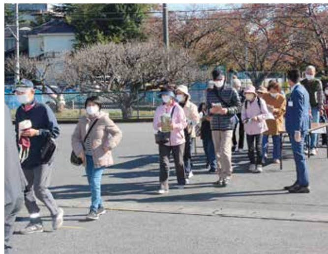
小かぶを求め大勢の皆さんが詰めかけました

生産量日本一を誇る柏市産小かぶのPRと、農住混在の中で行われている同市農業への理解促進を目的に、柏地区運営委員会は11月10日、柏集出荷場前で、コロナ対策を講じながら、旬を迎えた同市産小かぶの直売会を行いました。