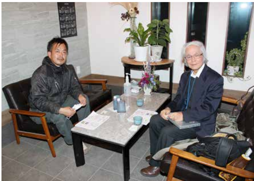
鈴木等野田地区青壮年部長のご自宅にて