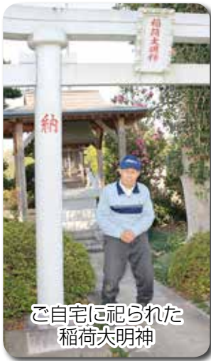
ご自宅に祀られた 稲荷大明神