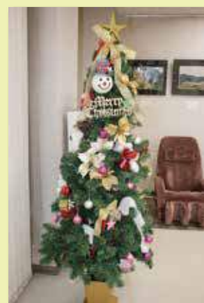
川間支店に飾られた クリスマスツリー