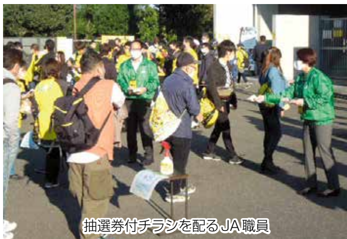
抽選券付チラシを配るJA職員

この日は、観客が入場した直後に抽選券付チラシ1,000枚を配布しました。ハーフタイムに抽選が行われ当選番号が決定。試合終了後に野田市のブースで、当選者へ小袋を手渡しました。例年この催しでは、両軍主将と審判団への特産品贈呈式を行いますが、今年はコロナ禍のために中止になりました。