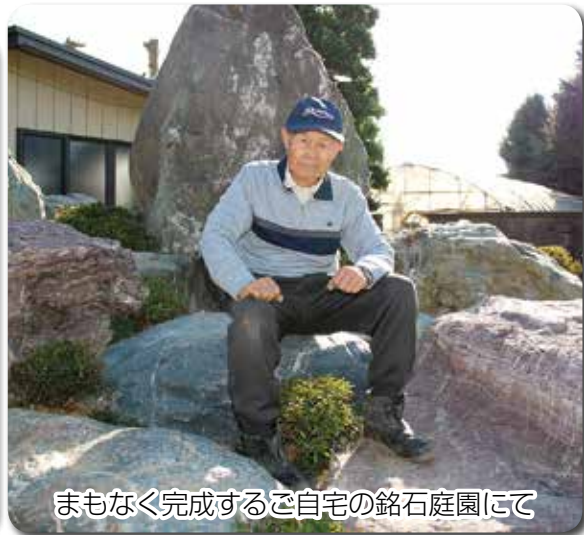
まもなく完成するご自宅の銘石庭園にて