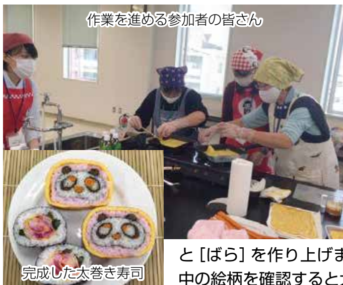
作業を進める参加者の皆さん