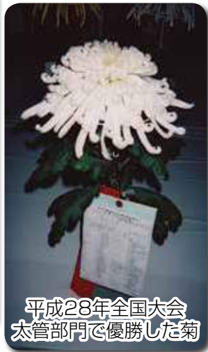
平成28年全国大会 太管部門で優勝した菊